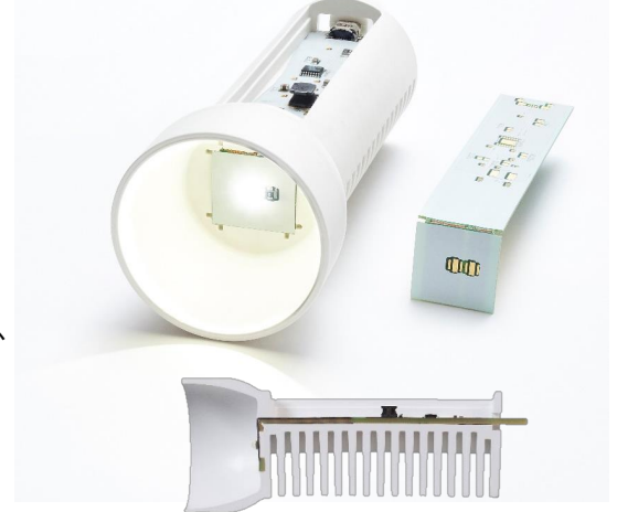
LEDランプのヒートシンク (PETベース、8W/mK品)

Lehmann & Voss社では、豊富な経験をベースに熱伝導性と成形性、機械特性のバランスを追求しています。