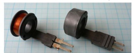
コイルヒーターの筐体 (PPSベース、3.5W/mK品)

優れた熱伝導樹脂を採用することにより、部品形状の自由度が高くなったり、コストを低減させられたり、部品の軽量化を実現したりすることが可能となります。