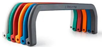
医療部品ハンドル（カラーPEEK）